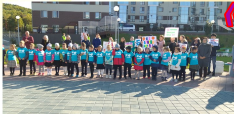
Неотъемлемой частью воспитательного